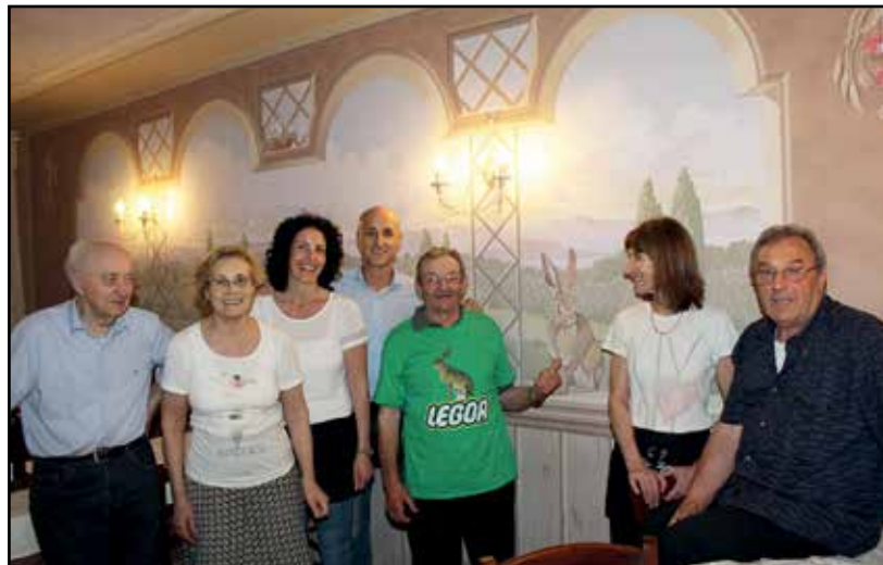
Raza con gli organizzatori della serata.