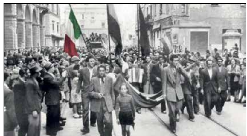
25 Aprile il giorno della Liberazione.

La guerra per noi non è altro che pagine di libri di storia, foto in bianco e nero e moltissimi film a tema: non abbiamo idea di cosa significasse vivere in Italia in tempo di fascismo, non sappiamo cosa voglia dire provare sulla propria pelle la povertà totale che solo una guerra può portare e, dal basso dei nostri vent'anni, festeggiare la conclusione di una guerra vecchia che è già al suo 75° anniversario non ci sembra nulla di più che ricordare l'ennesima ricorrenza storica. Inoltre, essendo noi cresciuti nel lusso della democrazia, tanto preziosa da risultare scontata, non riusciamo a comprendere davvero da cosa dovremmo sen-