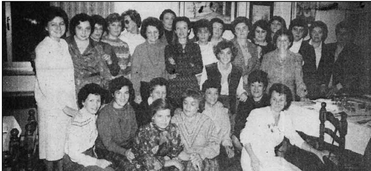
La classe 1940 presso il ristorante "Boschetti da Nicoli".

tivi coniugi. Erano i tempi della spensieratezza e del divertimento dove il ritrovarsi dei coetanei era di gran lunga molto più frequente che nei gironi nostri.