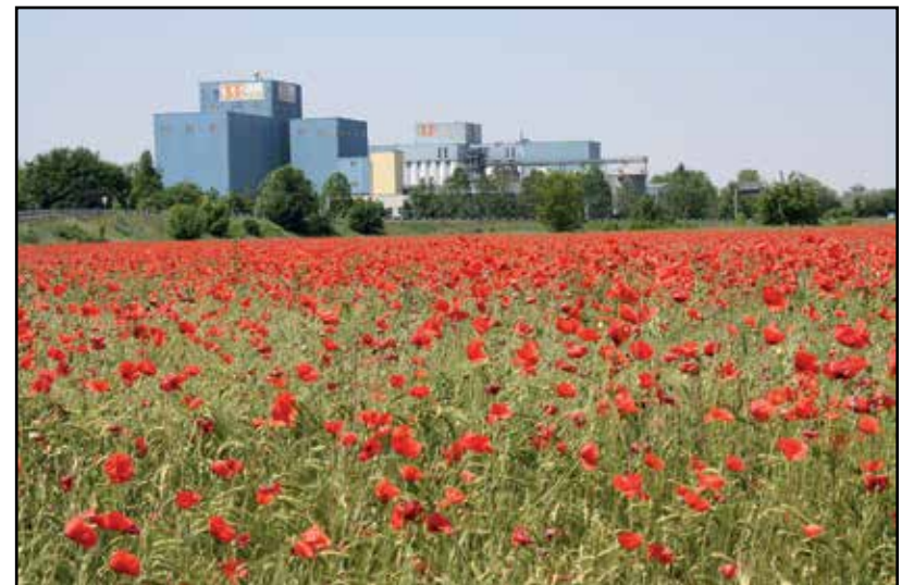
Papaveri nei prati.