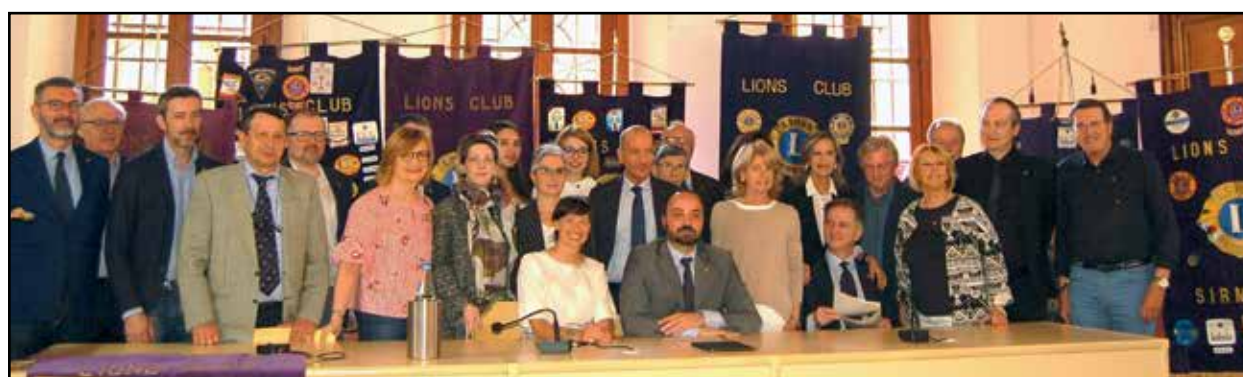
I Clubs coinvolti nel ricco programma di manifestazioni del mese di maggio.

Si inizierà il 3 Maggio a Sirmione con una Tavola rotonda sul tema "La giustizia riparativa come risorsa per l'Ambiente; il giorno 4 Maggio un