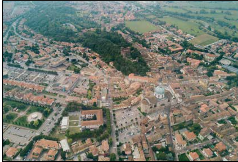
Una suggestiva visione di Montichiari.