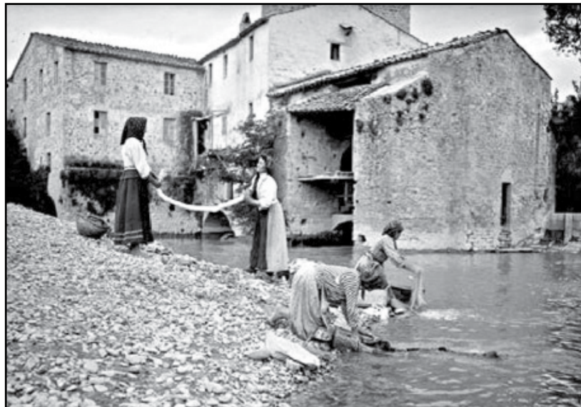
L'antico rito delle donne al fosso.

Poche parole per ricordare un aspetto della vita di mia mamma e delle mamme della sua generazione che hanno vissuto con poche comodità. Svolgevano i lavori di casa aiutandosi solo col famoso "òjo dè gombèt". Andavano a lavare la biancheria al fosso, inginocchiate in cassette di legno, anche d'inverno, senza guanti, procurandosi dolorosi geloni, con ciabatte, calzettoni di lana e una mantella sulle spalle. Portavano pesanti secchi e bacinelle ricolme di panni, comprese le lenzuola, che strizzavano poi aiutandosi tra di loro, tanto era scomodo e faticoso. Eppure accettavano senza troppo lamentarsi le difficoltà quotidiane per